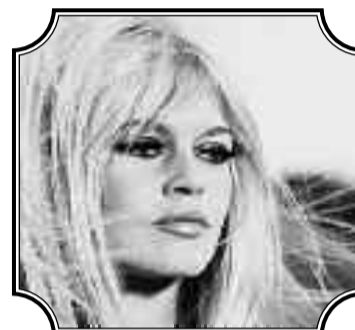
Brigitte à la belle époque

La pauvre Brigitte Bardot a perdus son chat chéri !