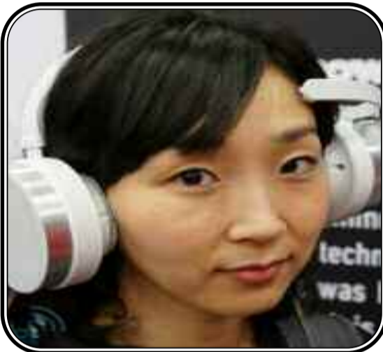
* Le gros fameux casque...

* SI CET APPAREIL est quelque peu encombrant, il est indiscutablement révolutionnaire. Le casque audio, appelé Mico, interagit directement avec le cerveau ce qui permet à son porteur d'écouter des morceaux selon son humeur. Vous n'aurez donc plus à parcourir en vain votre liste de lecture dans l'espoir de trouver le morceau qui concordera parfaitement avec votre humeur du moment, le Mico le fera pour vous. A en croire les réactions de ceux qui l'ont essayé, le Mico est bien ce qu'il prétend être. Grâce à un